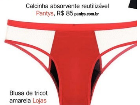
Calcinha absorvente reutilizável Pantys, R$ 85 pantys.com.br