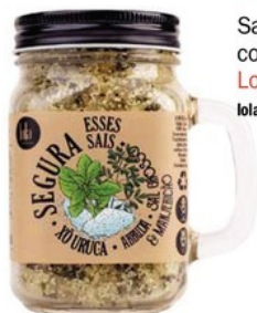
Sal de banho desodorante corporal Xô Uruca Lola Cosmetics, R$ 48 lolacosmetics.com.br