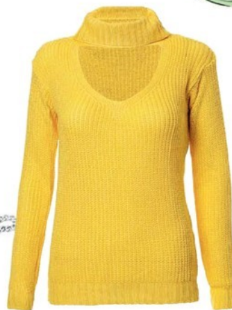
Blusa de tricô amarela Lojas Pompéia, R$ 69,90 lojaspompeia.com