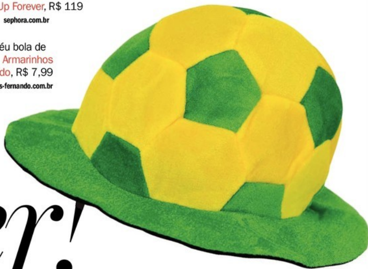
Chapéu bola de futebol Armarinhos Fernando, R$ 7,99 armarinhos-fernando.com.br