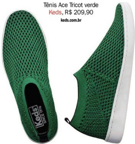
Tênis Ace Tricot verde Keds, R$ 209,90 keds.com.br