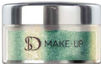
Glitter Ultimate Glittery cor Paradise SD MAKE-UP, R$ 36 sdmakeup.com.br

Não importa o time, a emoção é a mesma! Seja antes, durante ou depois,