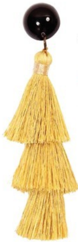
Brincos de franjas mostarda Zinzane, R$ 59,99 zinzane.com.br