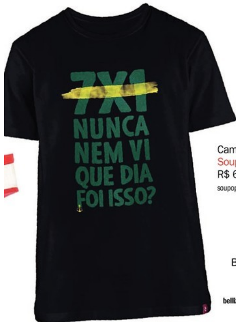
Camiseta 7x1 Soupop, R$ 69,90 soupon.com.br