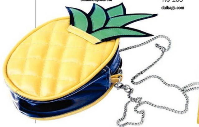
Bolsa Abacaxi Dai Bags, R$ 100 daibags.com