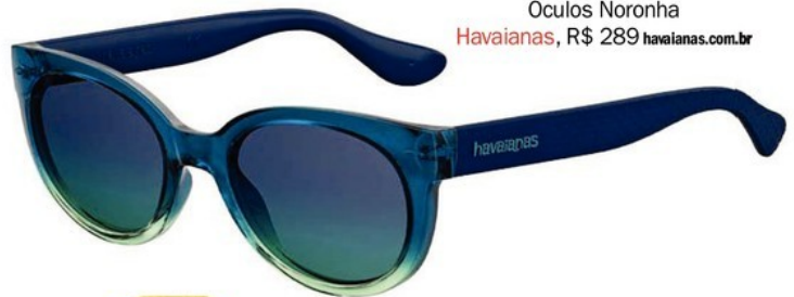
Óculos Noronha Havaianas, R$ 289 havaianas.com.br