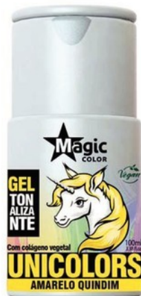
Gel tonalizante Amarelo Quindim Magic Color, R$ 29,50 magcprofissional.com.br